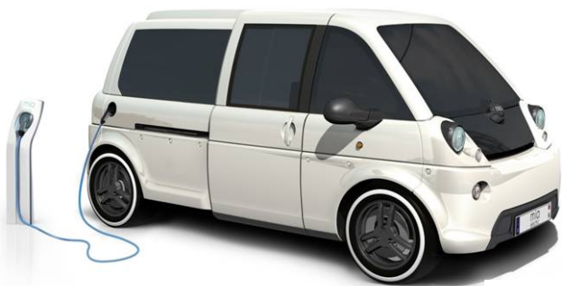
La Mia pour son côté « original ».