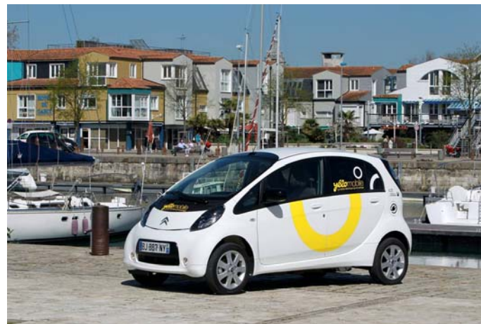
La C Zéro pour son côté « vraie voiture »